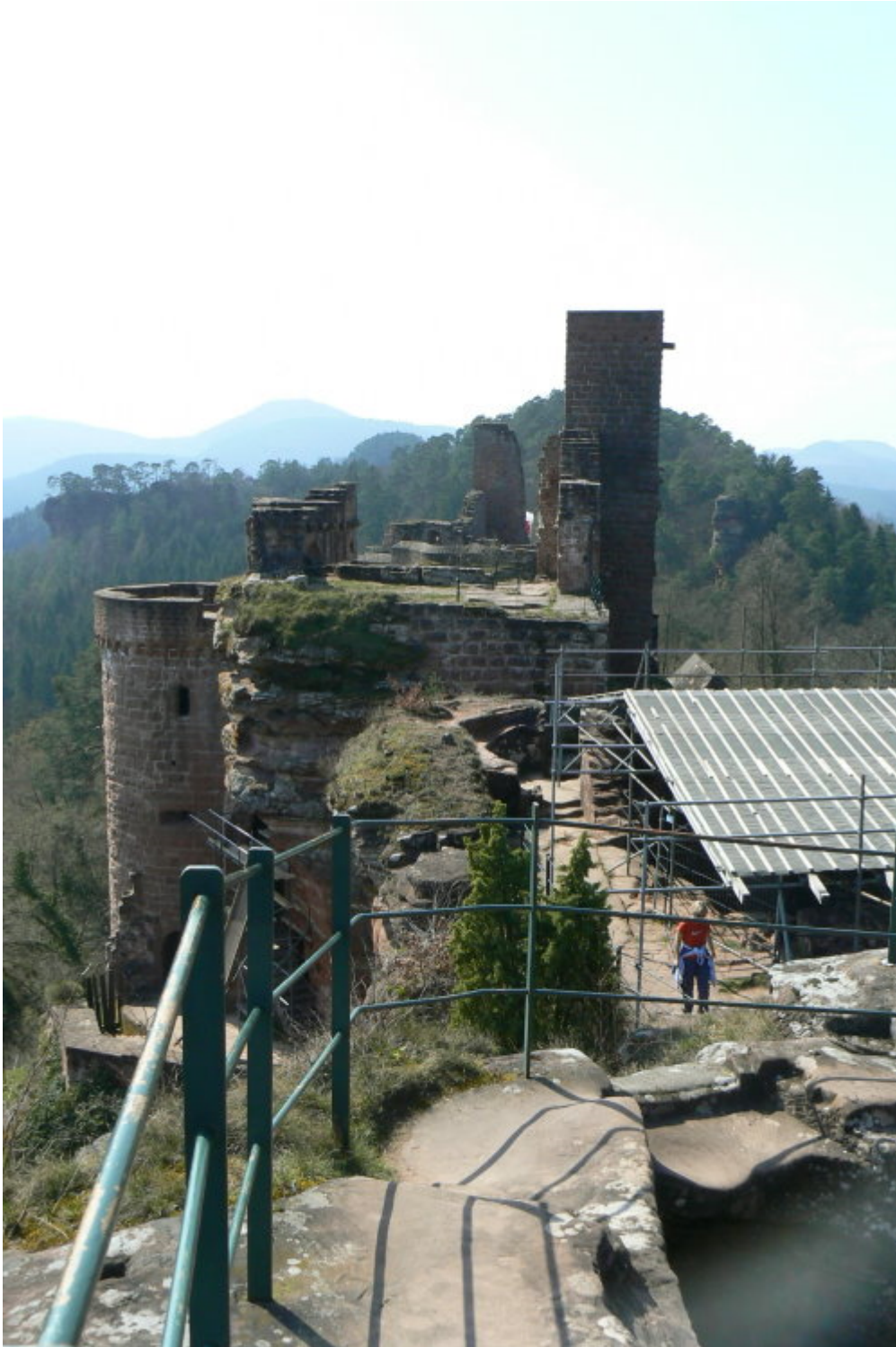
Blick von der östlichen Plattform nach Westen: links der südliche Geschützturm, Mitte der ehemalige Palas mit Turm, dahinter Reste von Grafendahn