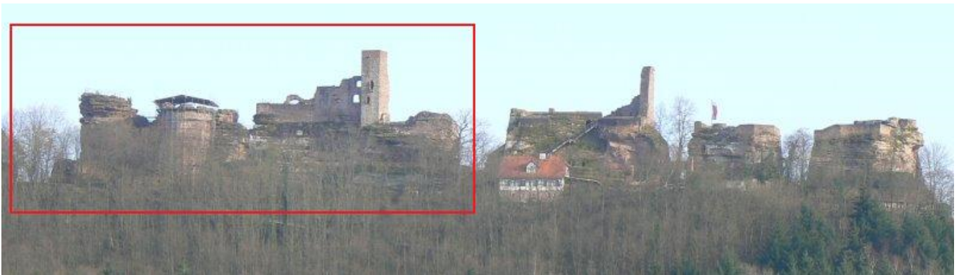
Blick von Norden

Mitten im Pfälzer Wald an der B427 zwischen Karlsruhe und Pirmasens liegt der Ort Dahn, welcher für seine Burgengruppe – die „Dahner Burgen“ bekannt ist. Die für Wanderer im Wasgau geeignete Umgebung wird auch „Dahner Felsenland“ genannt. Südöstlich von Dahn thront die Burgengruppe auf einem bewaldeten Höhenrücken. Der ca. 200 Meter lange und 30 Meter breite Felskamm wurde künstlich in drei Hauptteile und zwei Nebenteile zerlegt. 1 Auf ihnen befindet sich auf der Ostseite „Altdahn“ Im Mittelteil „ Grafendahn “ ( Grevendahn ) und auf dem Westteil „ Tanstein “ ( Dahnstein ). Wie auch die Pfälzer Burgen Fleckenstein und Drachenfels (siehe http://www.burgen-web.de/ ) gehört diese Burgengruppe zu den sogenannten „Felsenburgen“ 2