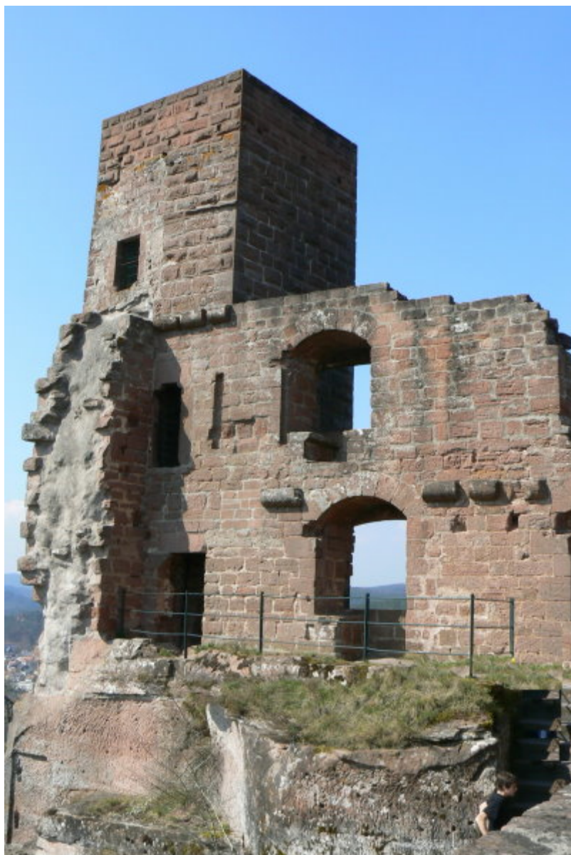
Turm mit Palasrest

Die südwestlichste Seite dieser Sektion ist einst herab gebrochen, heute ist nur noch ein schmaler Teil des dortigen Fundamentes des Palas zu sehen sowie ein Teil eines Silos, welches an der Abbruchkante des Felsens sichtbar ist.