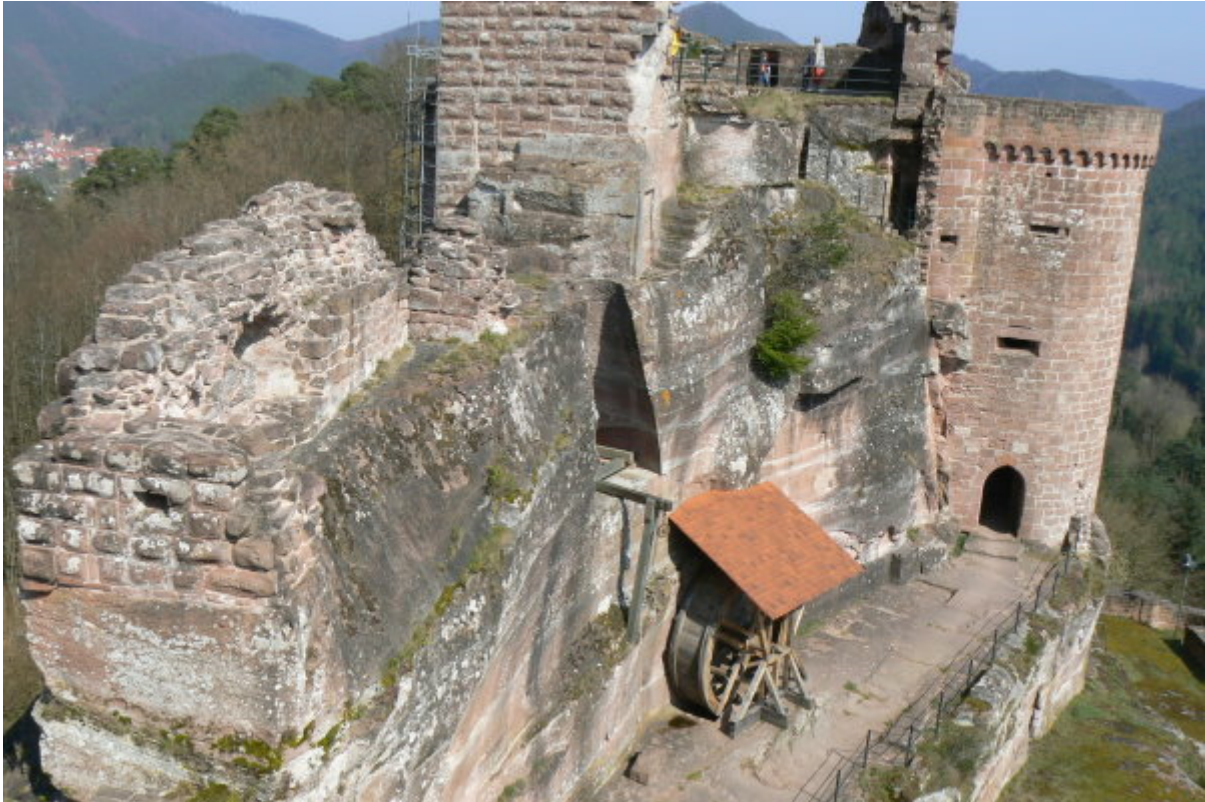
Sicht von Grafendahn:

links der Gebäuderest mit Abbruchkante, dahinter der Turm und rechts, der südliche Geschützturm