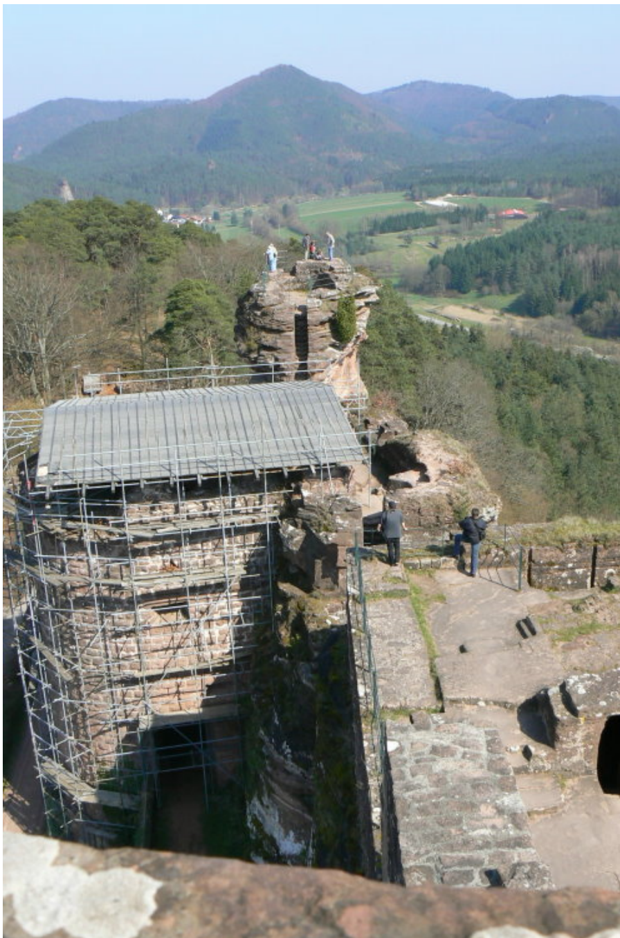
Blick nach Osten vom (links nördlicher Geschützturm)