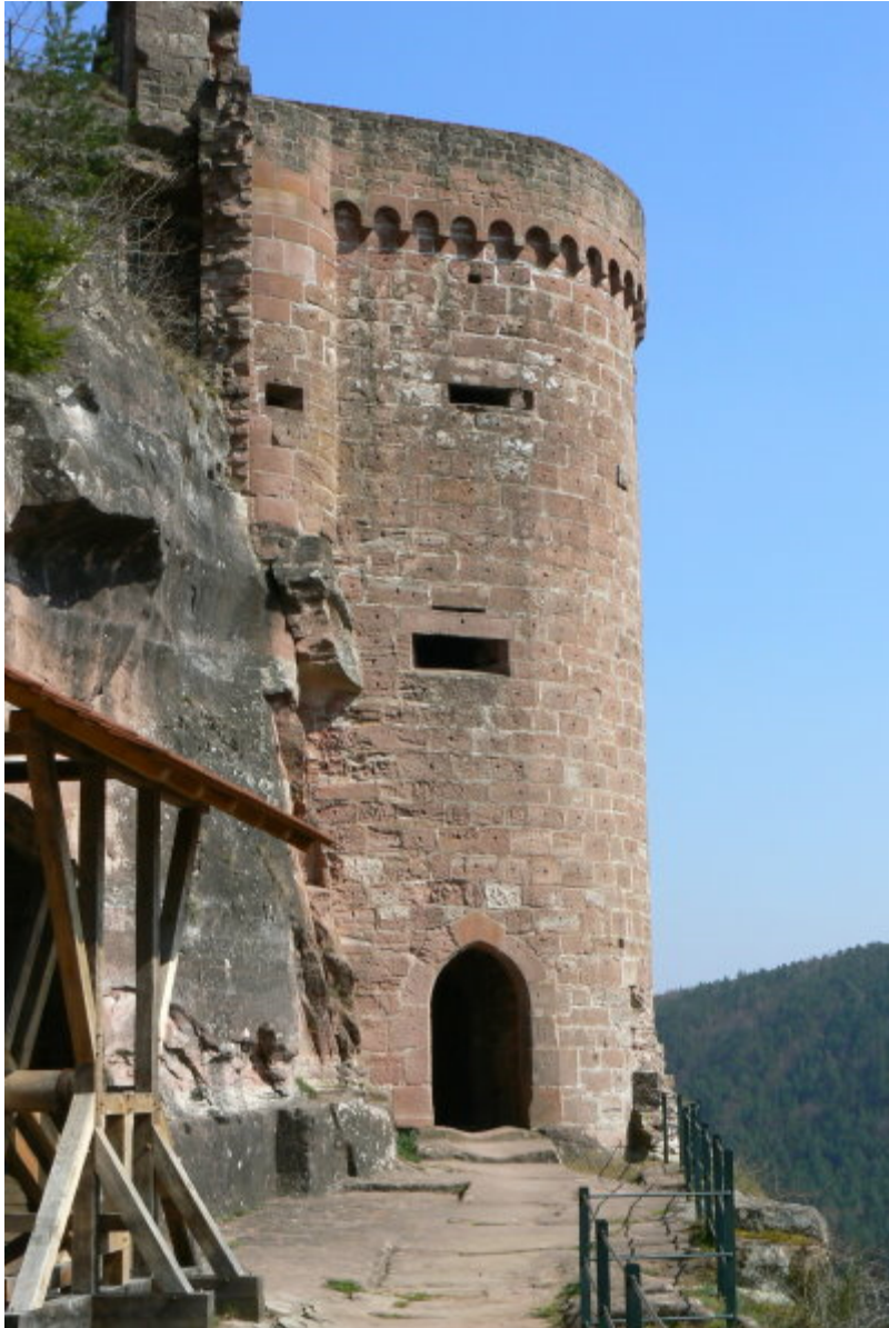
Südlicher Geschützturm mit Eingang

Umgeht man Altdahn auf der Westseite durch den in den Felsen gehauenen Graben zwischen Altdahn und Grafendahn, erreicht man durch einen Zwinger die Südseite. Dort ist ein weiterer halbrunder Geschützturm an die Westsektion der Burg angebaut, dem ein weiterer, Zwinger vorgelagert ist. Von hier erreicht man durch eine (moderne) Treppe und einen Felsengang vorbei an Kammern und einem Gang, welcher die Burg durchquert die Oberburg auf dem Plateau 6 . Die westliche Sektion der Burg war einst von einem Palas 7 überbaut, an dessen Nordseite ein (Treppen-?) Turm angebaut ist, den man heute noch über sehr steile Leitern erklimmen kann. (Achtung: Gutes Schuhwerk zwingend nötig!)