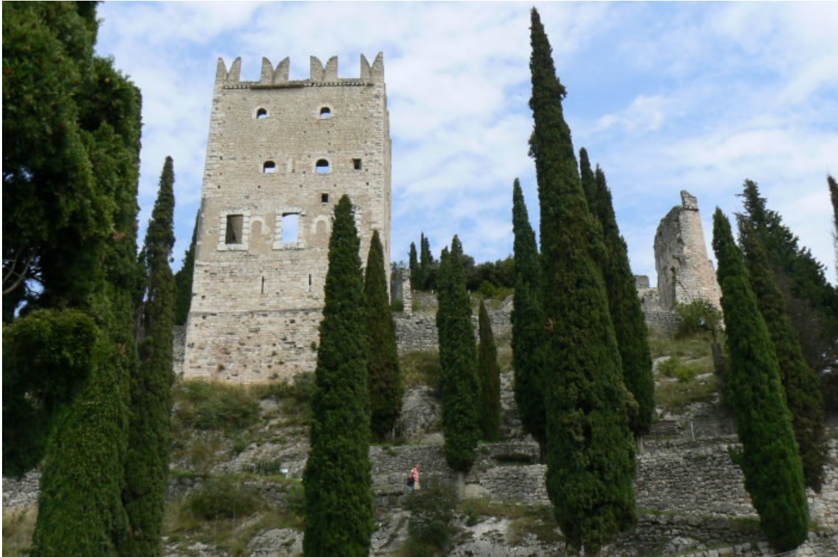
Torre Grande und Hauptburg von der Vorburg gesehen