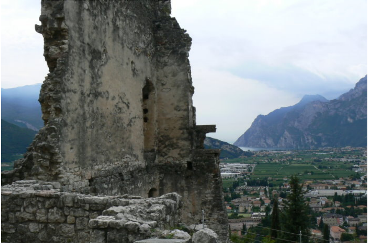
Gebäudeteil mit Blick auf den südlich gelegenen Gardasee

Von der Gipfelburg erfolgt der Abstieg nach Norden durch den Steineichenwald („Bosco di lecci“) zum nördlichsten Punkt der Burg. Hier an der Felswand stehen die Reste des Wachturmes in Richtung Laghel. Von hier verläuft der Mauerzug an der gefährdeten, nicht senkrecht abfallenden Nordwestseite des Berges, zurück zum Haupttor der Vorburg. Zwei ehemalige viereckige Türme unterbrechen die Mauer. Als Vorwerk befindet sich auf dieser Seite das ehemalige „Guarda di Mezzo“.