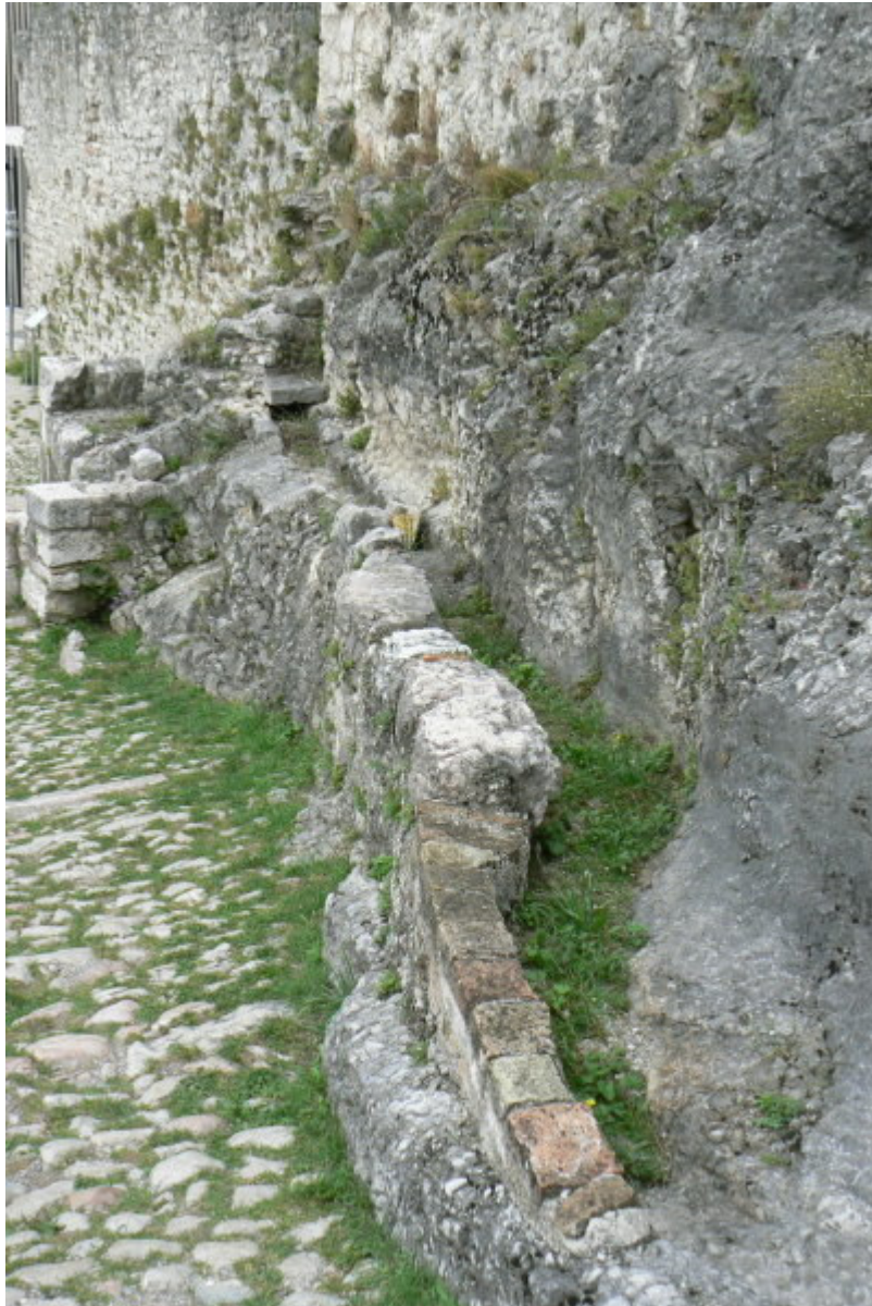
Kanal zu einer Zisterne

Drei der vier Mauerseiten sind von diesem mächtigen vierstöckigen Wohnturm noch erhalten. Auf der Nordwestseite befinden sich mehrere rundbogige Eingänge in verschiedenen Höhenniveaus. Hinter dem sich schützend am Eingang zur Hauptburg erhebenden Turm schmiegen sich die Gebäudereste der einstigen Hauptburg an die senkrecht abfallende Felswand. Zisternen versorgten die Burg mit Wasser.