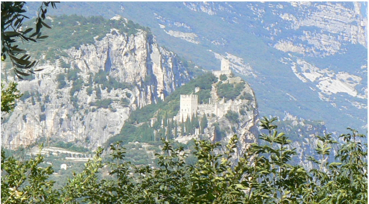
Burgberg von Osten

Uneinnehmbar und bizarr erhebt sich der Burgfelsen über dem Ort Arco im Sarcatal. Von den romantischen, mit Zypressen und Olivenbäumen eingerahmten Gebäuderuinen, kann der Besucher nach Süden zum Gardasee blicken. Albrecht Dürer verewigte den bizarren Anblick der Burg 1495 sehr detailgetreu in einem Aquarell. Die Mischung aus steilen und abweisenden Felswänden und Ruinen zwischen den Bäumen ist eine interessante Kombination aus warmem, südländischem Flair und kaltem, alpinen Bergpanorama.