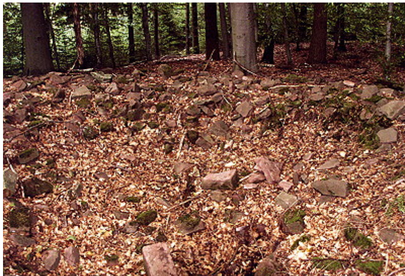
Reste der vermuteten Ringmauer auf der Ostseite

Es wird vermutet, dass die sehr entlegen positionierte Anlage schon um 1200 aufgegeben wurde.