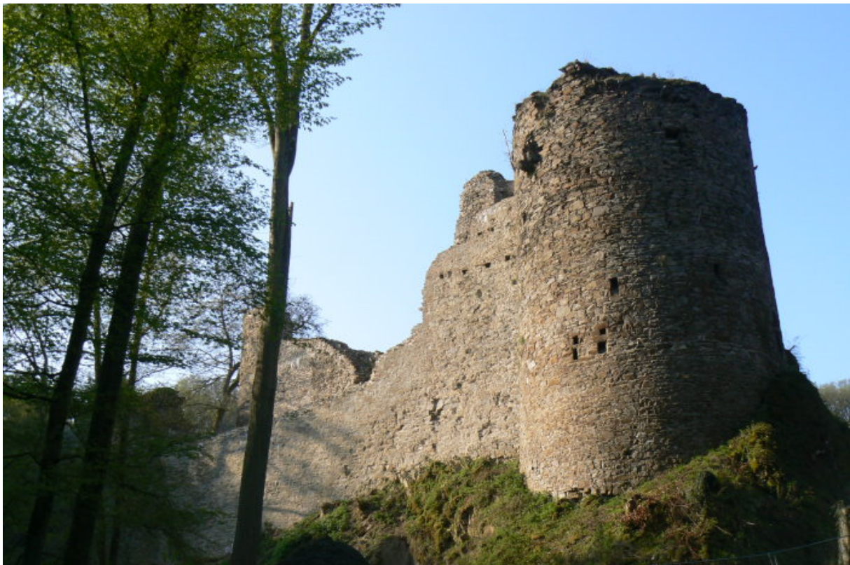
Kernburg mit Rundturm von Norden gesehen

In einem Seitental der Wied befindet sich an einer Bachschleife des Mehrbaches das kleine Kloster Ehrenstein. An dieser Stelle umfließt der Bach einen felsigen Spornausläufer. Dieser Spornausläufer, welcher sich einige Meter über der Talsohle erhebt, wird von der kleinen Ruine Ehrenstein dominiert.