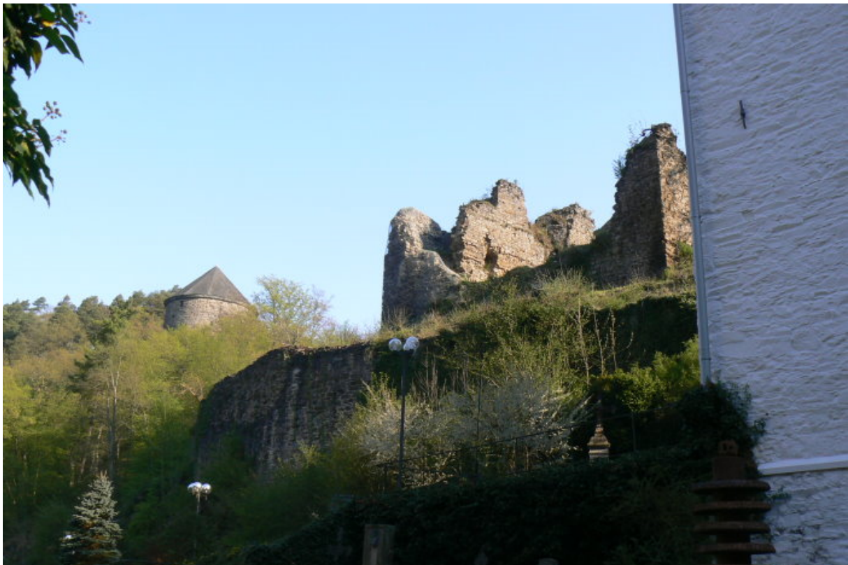
Artillerieturm, Kernburg mit Zwingermauer, Resten einer Palaswand und Kirche (links)

Die vor 1477 errichtete Burgkapelle wurde zur Klosterkirche und später erweitert. e Im Dreißigjährigen Krieg wurde die Burg 1632 durch die Schweden zerstört. Ab 1526 war Burg und Besitz Ehrenstein kurkölnisches Lehen von Wilhelm von Rennenberg. Die Herren von Nesselrode (Wilhelm) kauften die Anlage bereits 1584 zurück. Bis 1993 war die Ruine im Besitz der Familie von Nesselrode. Damals verzichtete der Graf von Nesselrode auf seine Eigentumsrechte an der verfallenen Ruine. Die Burg wurde herrenlos. Seit einigen Jahren wird die Ruine vom Landesdenkmalamt Rheinland-Pfalz gesichert und restauriert.