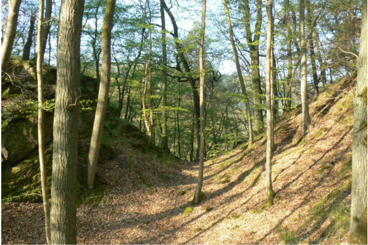
Sichelförmiger Graben vor dem Artillerieturm

Beim Besuch im Jahr 2011 war die gesamte Burg gesperrt. Eine Sanierung der Mauern und das Freilegen des Baubestandes von Vegetation ermöglichen seitdem einen guten Blick auf das Mauerwerk, welches im Moment vor weiterem Verfall gesichert wird.