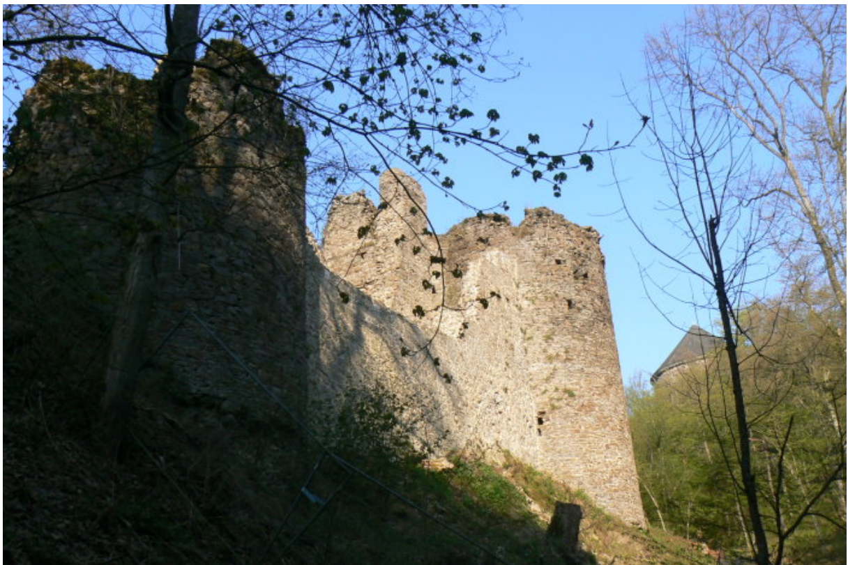
Nordostseite mit Halbschalenturm, Rundturm und Artilleturm

Die Burg erreicht man über die Autobahn A3. Diese an der Ausfahrt 35 Neustadt (Wied) verlassen. Von hier nach Nordosten Richtung Bertenau fahren und der L 270 nach Norden folgen. Nach Osten durch Eilenberg ins Tal der Wied fahren (Richtung Peterslahr), Hier scharf links nach Norden auf die L269 abbiegen und die nächste Straße rechts zum Kloster abbiegen. Parkmöglichkeiten befinden sich direkt vor dem Kloster. 2011 war die Burganlage nicht betretbar. Das Klostergelände und die Außenansicht der Ruine entschädigen aber den Wanderer, welcher dieses romantische Tal durchquert.