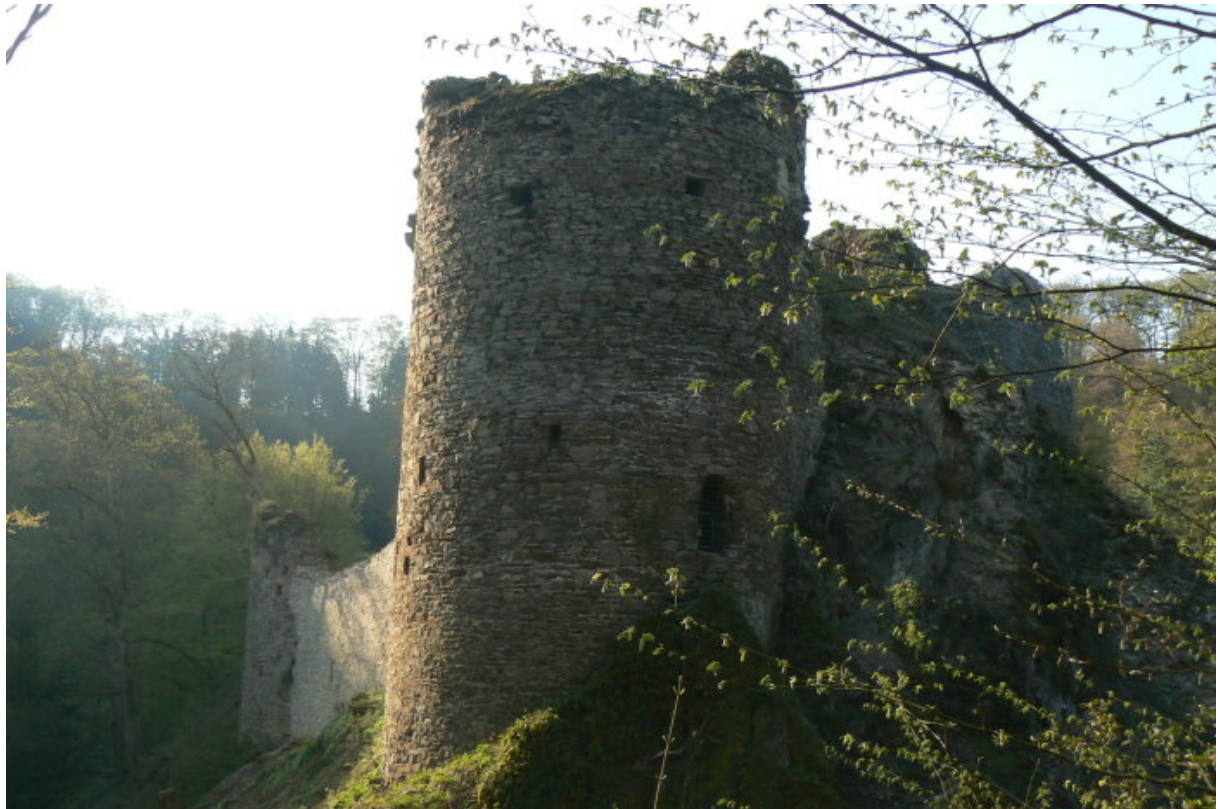
Blick vom Artillerieturm über den Halsgraben auf den Rundturm der Kernburg

Vom Klostergelände verläuft der einstige Zugang auf der Südseite der Burg durch eine Toranlage in die an der Spornspitze sich befindenden Vorburg. Die Vorburg ist noch anhand von Mauerresten erkennbar. Die Südostspitze der einstigen Vorburg fällt als Fels einige Meter zum Tal und Bach hin ab. Die Kernburg besteht aus einem Mauergeviert, welches wie ein Zwinger einen wohnturmartigen Palas umgibt. Der fünfeckige Palas erhebt sich noch als Ruinenrest und war durch zwei quer verlaufende Mauern unterteilt. Die Spitze zeigt zum Halsgraben hin, um einem Angreifer eine keilförmige Mauer zu bieten und sich dadurch vor Beschuss besser zu schützen. Auf der Nordostseite, auf der anderen Seite des Tales, fällt der Fels mehrere Meter steil ab. Hier wird die Kernburg von einem südöstlichen Halbschalenturm flankiert. Ein weiterer Rundturm steht an der Nordostseite am Rand zum Halsgraben. Reste eines Abtrittes sind auf der Talseite des Turmes im oberen Bereich sichtbar. Auffällig ist die schildmauerartige und bis zu 3 Meter dicke Mauer auf der Nordwestseite, welche halbrund vor dem Palas nach Norden abknickt und über dem Halsgraben verläuft. Zwischen Mauer und Rundturm wurde zur Angriffsseite ein natürlicher Fels in die Mauerfront integriert.