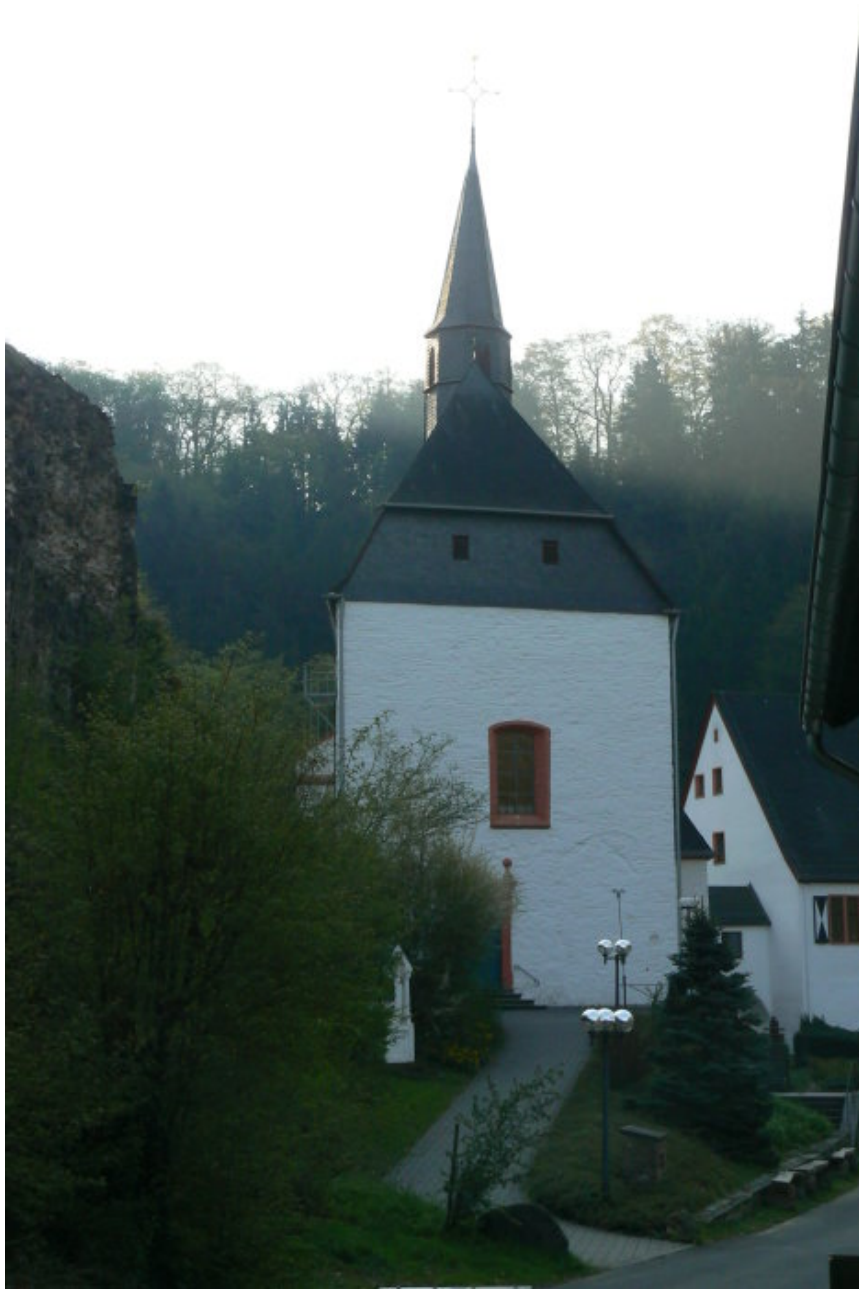
Kirche (links der Burgfelsen)

Das schmale Tal wird von mit Wald bewachsenen Hängen begrenzt. Der Sporn mit der Burg steigt nach Norden hin zum Berg an. Ein Halsgraben trennt den Sporn mit dem Burgareal vom Berg ab. Heute verläuft hier der Weg bachaufwärts durch den breiten Graben weiter durch das Tal. Wie eine Klausen wird die nördliche Bachseite der Talsohle durch das Kloster zwischen Bach und Burgfelsen gesperrt. Zwei kleine Türme flankieren das Klosterareal auf der Nordseite bachabwärts. Die Reste der Mauer zwischen den Türmen erinnern an die Wehrhaftigkeit der Klosteranlage. Das Kloster selbst besteht heute aus gut erhaltenen Wohn- und Wirtschaftsgebäuden, sowie einer kleinen Kirche am Rande des Burgareales.