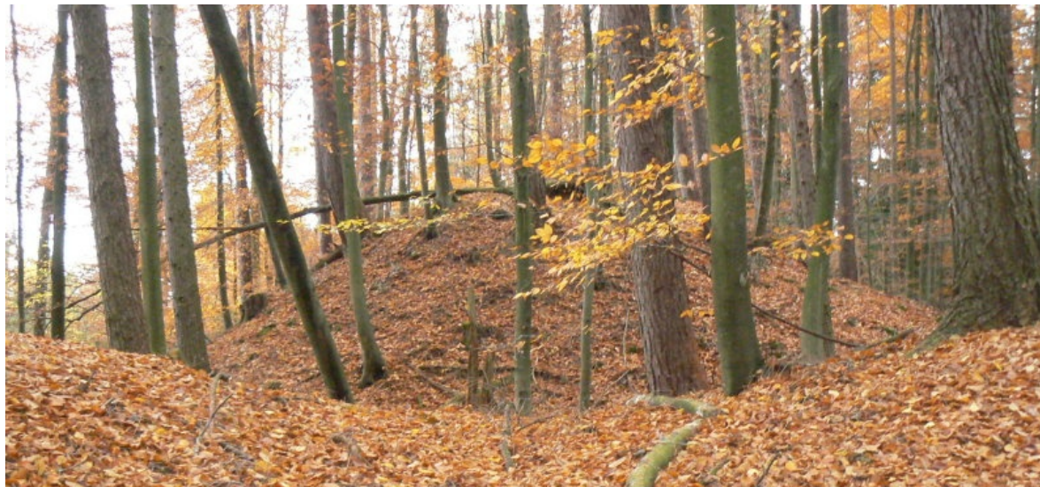
Blick über den inneren Graben auf den Turmhügel

Der Name der ehemaligen Odenwälder Burg weckt romantische Erinnerungen. Tief im Wald versteckt ist nur noch das Säuseln des Windes zu hören. Die Harfe des dort offenbar einst beheimateten Minnesängers Bigger ist bereits seit über 800 Jahren verklungen. Diesen Artikel haben wir auf Grund der breiten Panoramaaufnahmen im Querformat erstellt.