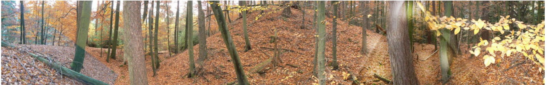
Sicht aus dem inneren Graben nach Süden auf den Turmhügel

Die Harfenburg soll in einem Vertrag zu Pavia in Zusammenhang mit der Wittelsbacher Erbteilung erwähnt worden sein. Als die Besitzer- die Harfenberger Linie offenbar Steinacher Ursprungs- ausstarb, wurde um 1300 der Besitz von der Kurpfalz erworben und an Hirschhorn weiter verpfändet. Danach muss es zwischen 1339-40 bei Streitigkeiten zwischen den Hirschhornern und dem Pfalzgrafen zu einer Zerstörung der Anlage gekommen sein, denn um 1340 forderte Pfalzgraf Rupprecht I. die Besitzer zum Wiederaufbau auf. Es kam offenbar zu keinem Wiederaufbau, denn die Anlage war seither ruinös und verfiel. 1388 wurde die Burg oder der Rest derselben nochmals als Lehen genannt. Die Familie der Harfenberger bestand offenbar noch in einer weiteren Linie und wurde letztmalig 1424 in Quellen genannt. Mitte des 16. Jahrhunderts wurden noch Ruinenreste der Harfenburg erwähnt. Das nach 1270 urkundlich erwähnte Geschlecht der Hirschhorner Ritterschaft soll familiäre Verbindungen zur Linie der Harfenberger gehabt haben, was durchaus auch aufgrund der Nähe wahrscheinlich ist.