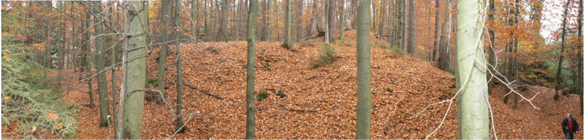
Sicht nach Norden von der Vorburg über den inneren Graben auf die Kernburg und den Turmhügel (Mitte)

Der Odenwald bietet ideale Wandermöglichkeiten und lockt nicht nur mit den Burgen im Neckartal an seinem südlichen Rand, sondern mit vielen kleinen, oft schon verfallenen Burgen zu Wandertouren durch die Natur.