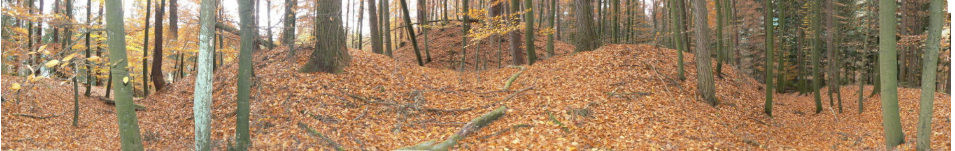
Sicht aus dem mittleren Graben nach Süden auf den Turmhügel und Wall zum inneren Graben

Dickicht einer Schonung, auch diese ist auf allen Seiten durch einen Graben mit einer wallartigen Aufschüttung auf der Außenseite umgeben. Die Staffelung der Wälle und Gräben erinnert an den Burgstall Hohenacker 4 oder an den Burgstall Gabelstein 5 .