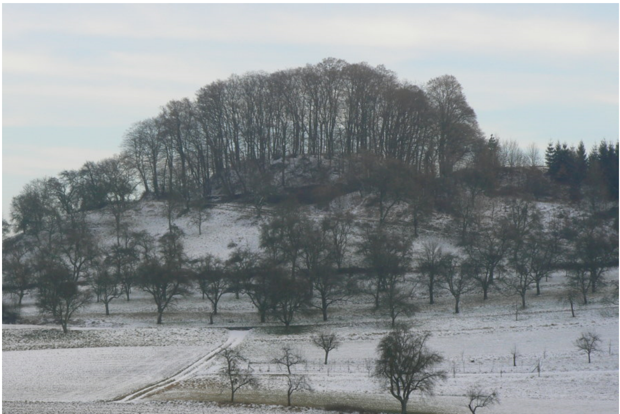
Blick von Hohenacker (Nordwesten)

Südwestlich von Öhringen im Hohenlohekreis liegt in einem Tal der Löwensteiner Berge der Ort Unterheimbach, über den sich im Westen ein Bergsporn erhebt. Auf der bewaldeten Bergspornspitze, welche kuppenartig über dem Umland sitzt befindet sich die Ruine Hellmat, an die noch ein Bergfriedstumpf erinnert.