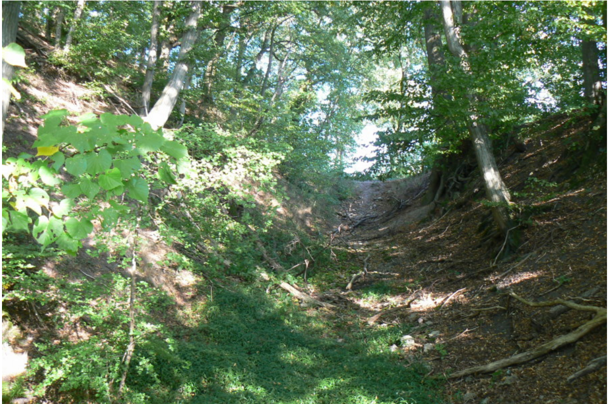
Halsgraben von Westen gesehen