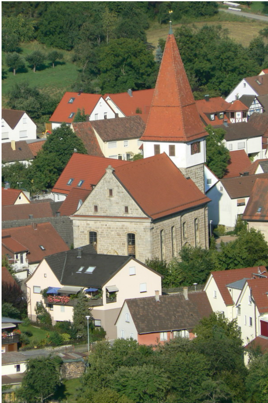
Blick von der Ruine auf die Kirche in Unterheimbach

Die Wanderung Richtung „Kriegshölzle“ nach Nordwesten zur Burg Hohenacker lohnt sich. Gastwirtschaften befinden sich im Ort Unterheimbach.