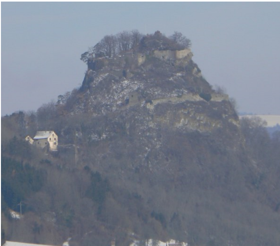
Blick vom Hohentwiel auf den Hohenkrähen

643 Meter hoch erhebt sich der schmale Vulkankegel des Hohenkrähen über dem Tal der Saub aus dem Hegau empor. Der Phonolithkegel selbst ragt aus der Landschaft wie ein hoch gemauerter Turm heraus und zieht die Blicke des von Norden kommenden Autobahnreisenden auf sich. Erst der zweite Blick fällt dann auf den wesentlich mächtigeren, südlich davon gelegenen Hohentwiel 1 mit seiner gleichnamigen Festung. Auf dem schmalen Fels des Hohenkrähen haben die einst schwindelfreien Erbauer ihre Burg errichtet, deren Ruinenreste sich romantisch in den Himmel erheben.