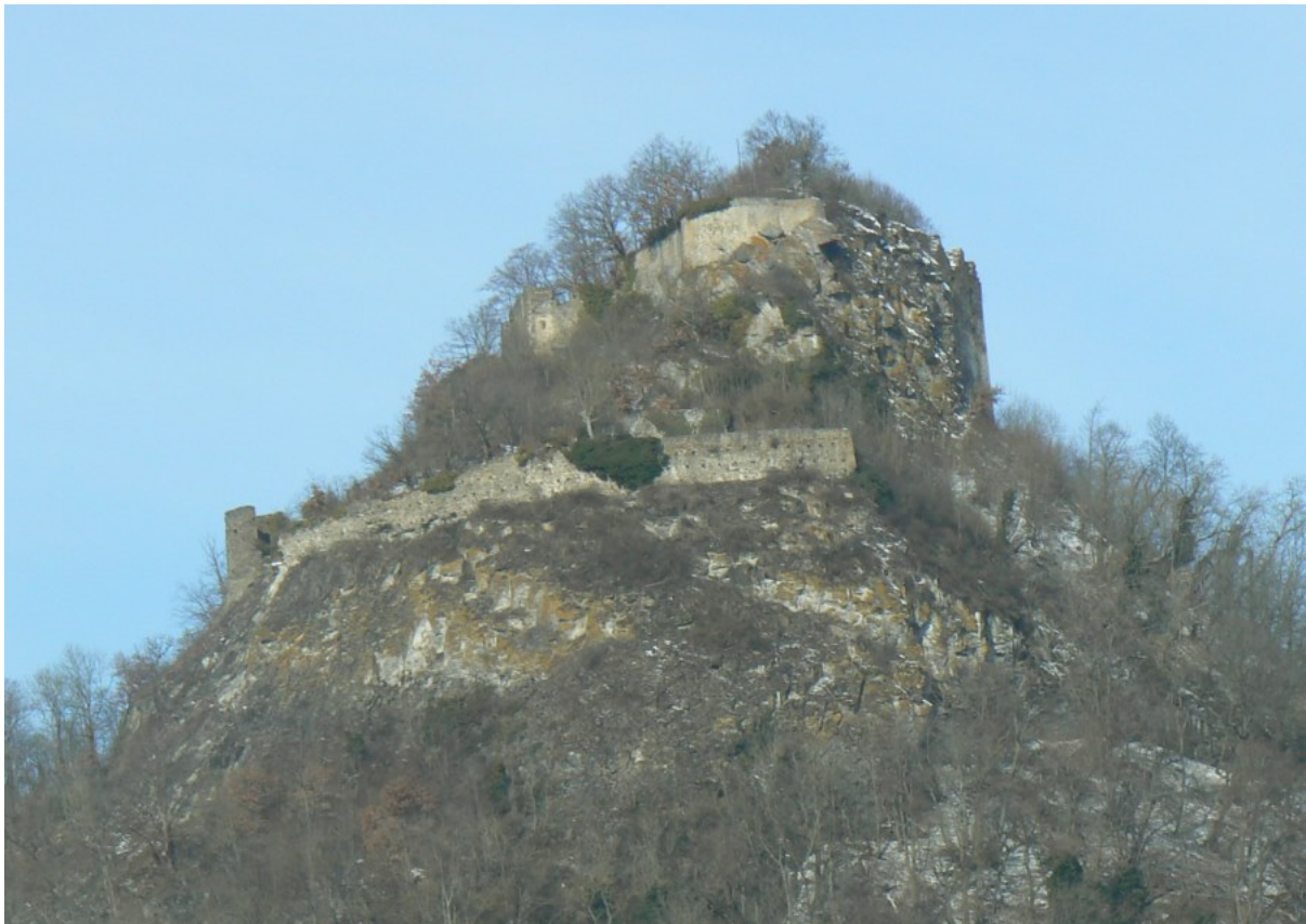
Ruine von Südosten gesehen- unten die „Mittelburg“, darüber die „Österreichische Bastion“

Auf dem Bergplateau sind Reste von Zisternen sichtbar. Das Sammeln von Regenwasser war die einzige Möglichkeit, sich mit Trinkwasser zu versorgen.