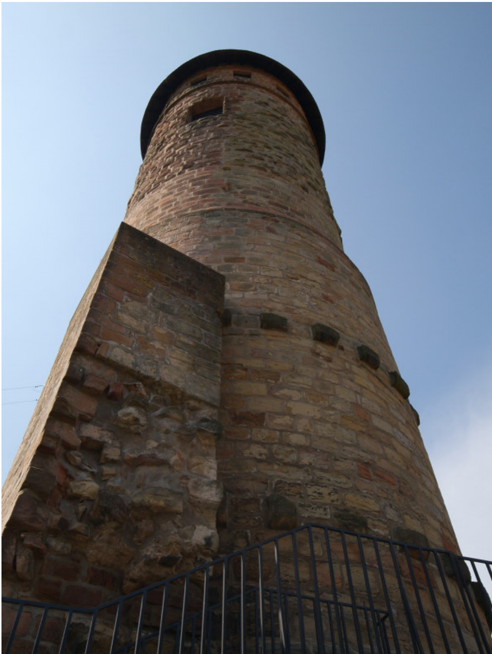
Runder Bergfried mit Resten der Palaswand

Gegenüber erhebt sich der runde Südturm, welcher mit seiner neu gestalteten Aussichtsplattform und dem neuen Kegeldach 28 Meter hoch ist. Zwischen den beiden Türmen befand sich der Palas, von welchem keine Reste mehr vorhanden sind. Auf dem Oberburgplateau ist noch ein 5,4 Meter tiefer, kellerartiger Schacht erhalten, welcher eventuell als Keller oder Zisterne diente. Von der Vorgängeranlage ist noch der ehemalige halbrunde Nordturm zu erahnen, welcher sich direkt vor dem heutigen Polygonalturm auf dem Burgplateau befand.