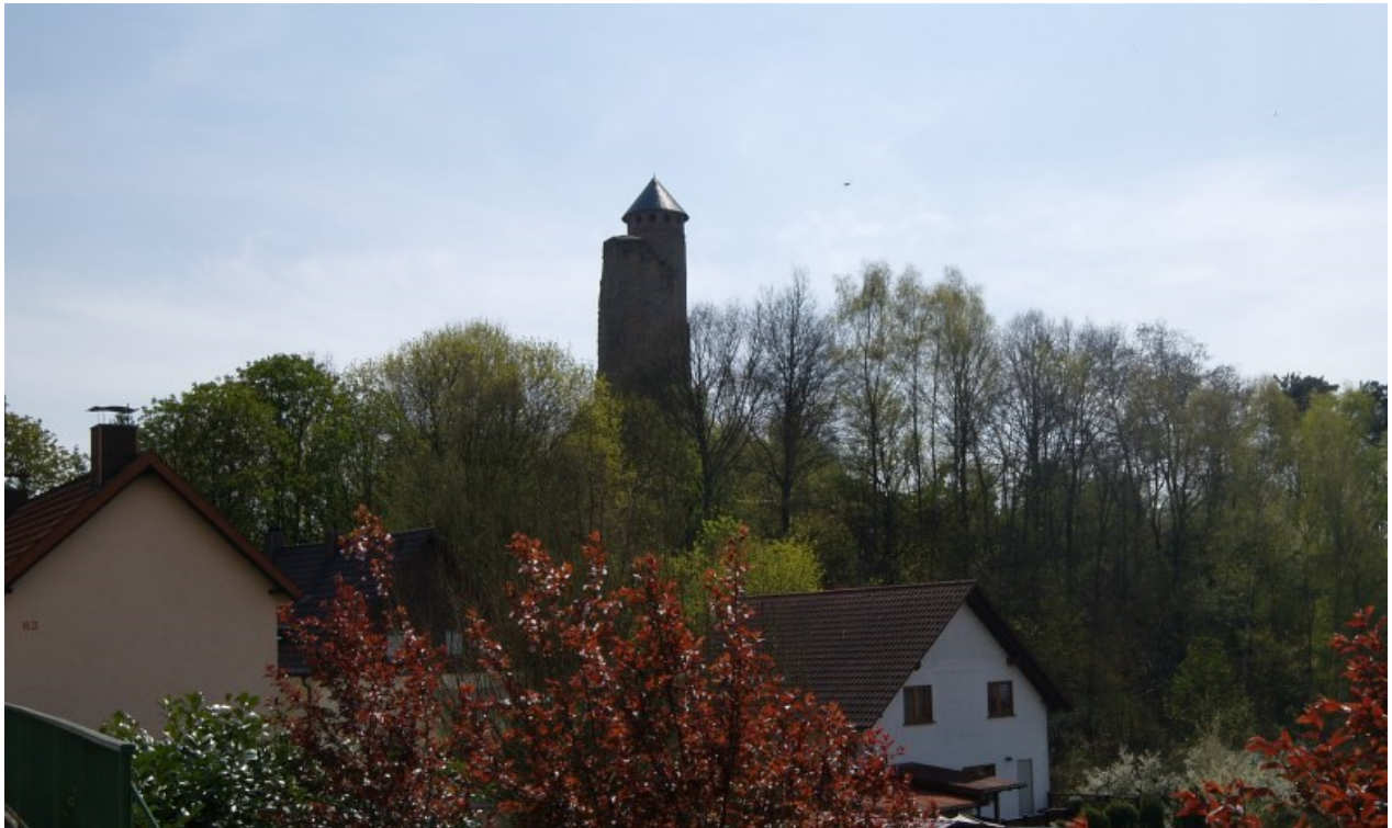
Burgberg von Norden gesehen

Auf einem natürlichen, ovalen Sandsteinfelsen erheben sich die Ruinenreste der Oberburg. Interessant ist die Bauweise mit zwei bergfriedartigen Türmen, welche auch z.B. auf der Burg Münzenberg 1 und der Burg Neipperg 2 zu finden sind. Häufig wurden bei größer ausgedehnten Burganlagen zwei oder mehrere Türme erbaut, um die Burgen großflächig zu verteidigen. Bei dem kleinen Areal von 30 Meter auf ca. 10 Meter Fläche der Oberburg von Kirkel ist diese Bauweise eher ungewöhnlich.