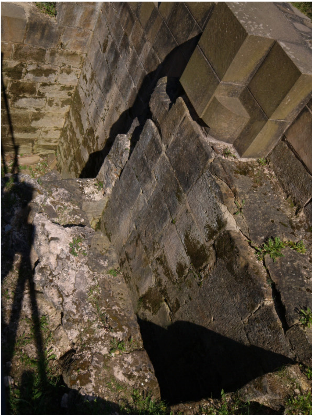
Zugbrückenanlage im ehemaligen „Neuen Bau“

Im Dreißigjährigen Krieg und später in den Reunionskriegen wurde die Burg schwer beschädigt und 1677 durch französische Truppen teilweise geschliffen. Danach wurde die Ruine ab 1740 als Steinbruch für die Bevölkerung mißbraucht. Erst seit der zweiten Hälfte des 20. Jahrhunderts erfolgten umfangreiche Ausgrabungen und Sicherungsarbeiten.