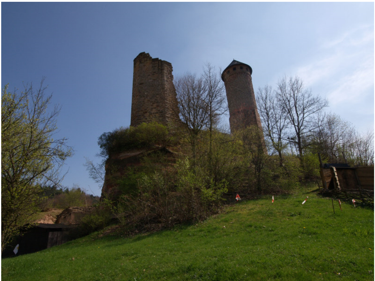
Burgberg von der Vorburg gesehen

Den Burgfelsen erreicht man über die ehemalige Vorburg , welche den Burgberg im Westen und Norden umgab. Gedeckt vom polygonalen Turm befand sich einst das Tor mit einer Zugbrücke, welches von Norden in den nordöstlich der Kernburg gelegenen Zwinger führte, dessen ehemalige Mauern nur noch zu erahnen sind.