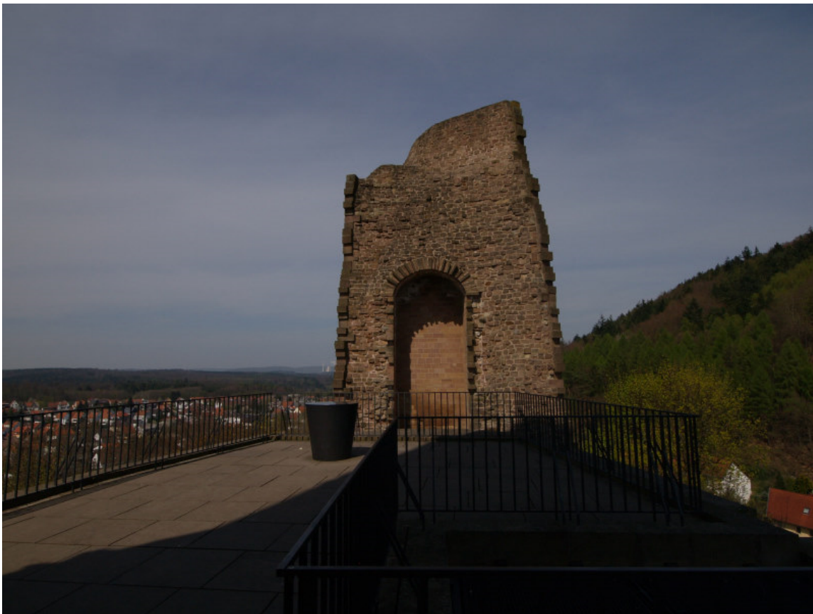
Plateau auf der Oberburg