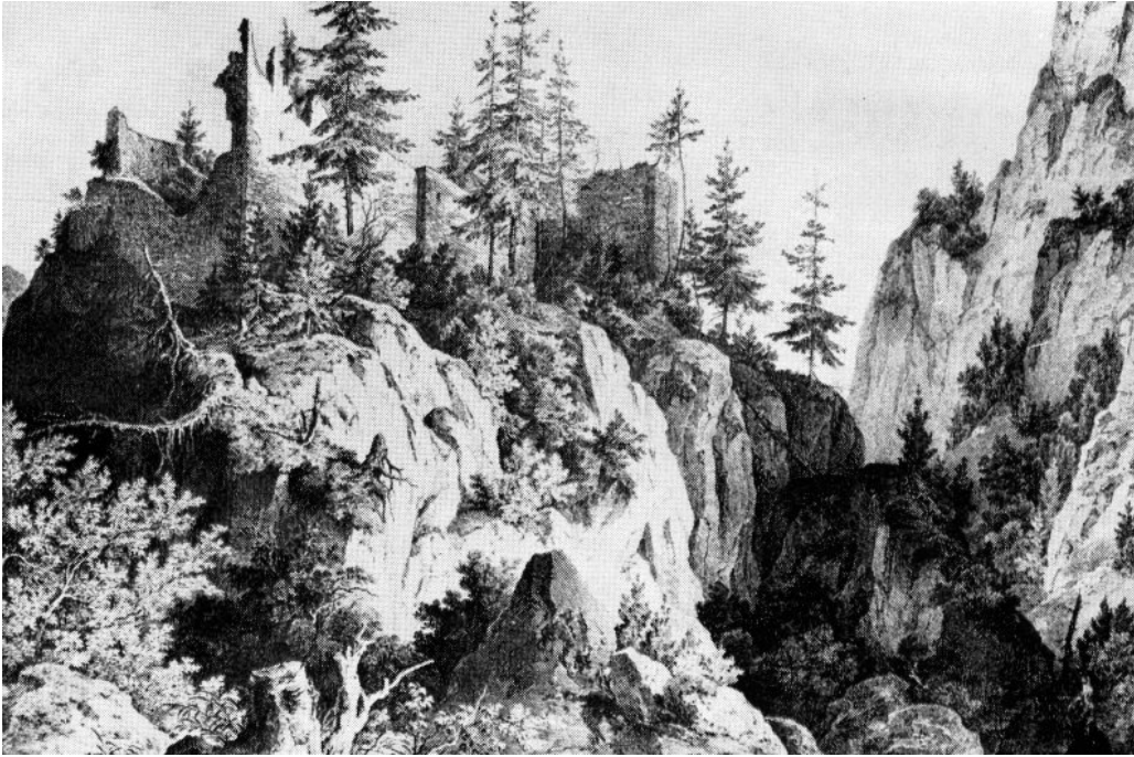
Stich von 1850

Auf einem steilen Fels, welcher durch die tiefe Pöllatschlucht vom Bergmassiv getrennt ist, standen bis Mitte des 19. Jahrhunderts die beiden Ruinen Vorder- und Hinterhohenschwangau , zusammen auch Hohenschwangau genannt. Auf dem Stich sind die Reste gut zu erkennen, links (Westen) Vorderhohenschwangau als ca. 30 Meter lange und 10 Meter breite Turm-Hof-Palaszburg 2 mit dem Turm auf der Ostseite zur Nachbarburg gebaut. Ein 10 Meter tiefer Graben trennte die Burg von der östlichen Hinterhohenschwangau (auch Sylphenturm genannt). Diese kleine Burg bestand nur aus einem ca. 13 Meter im Quadrat messenden Wohnturm.