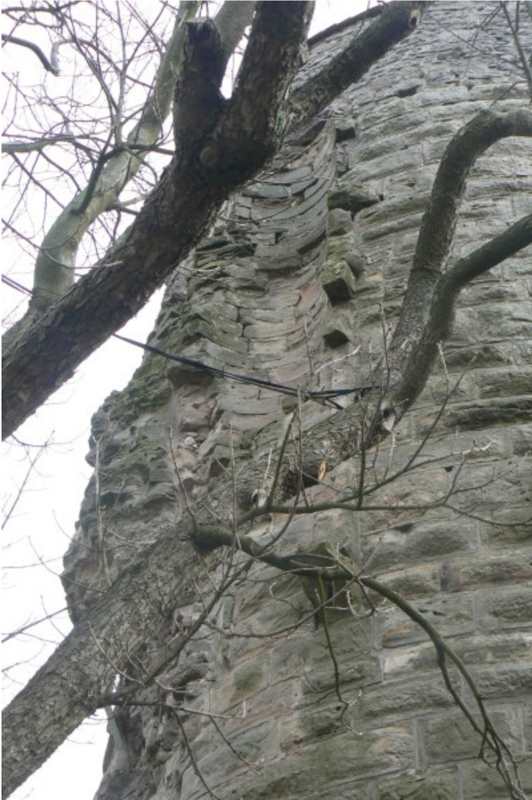
Nordseite des Turmes mit Maueransatz und Rest Treppenturm