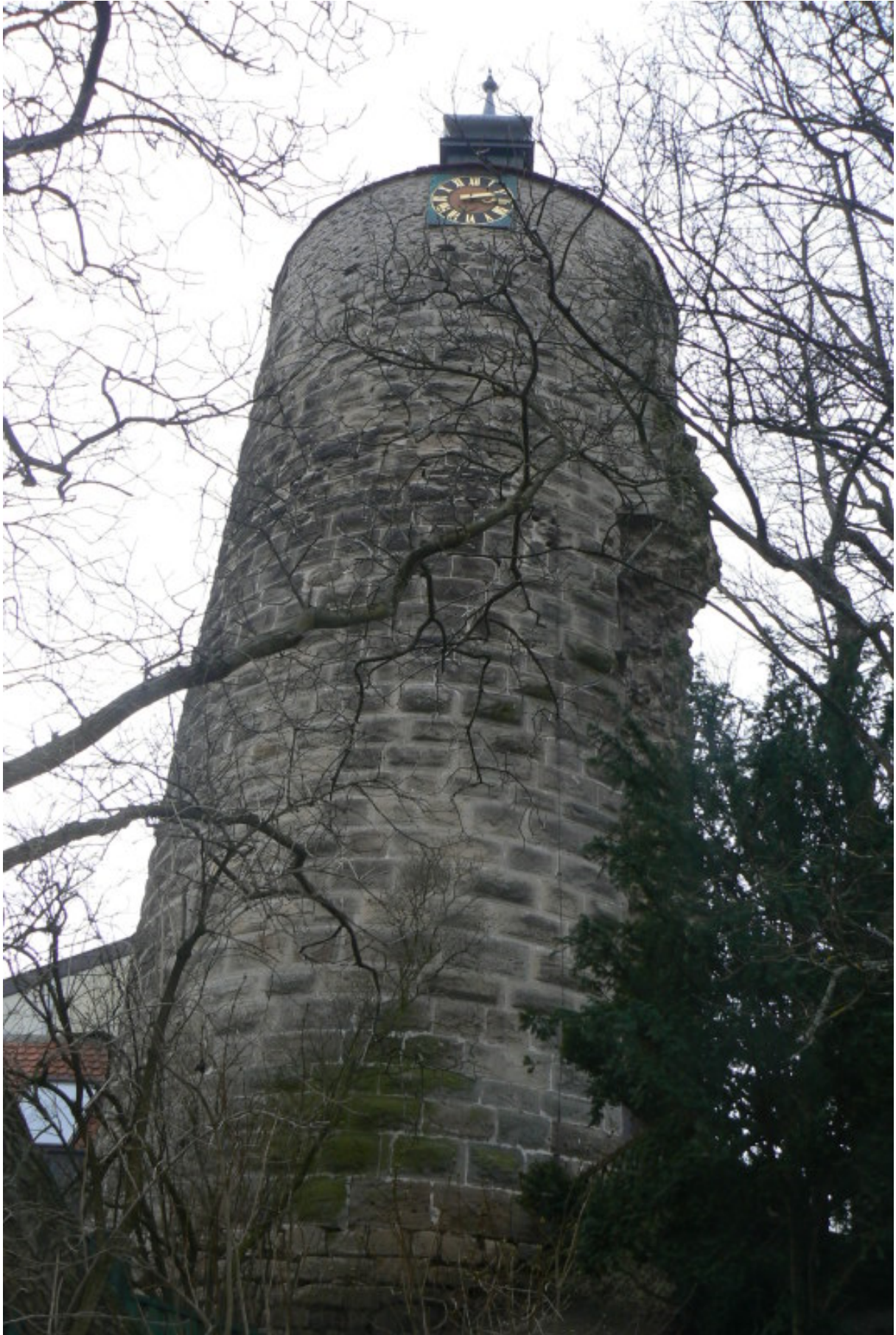
Turm vom Halsgraben gesehen