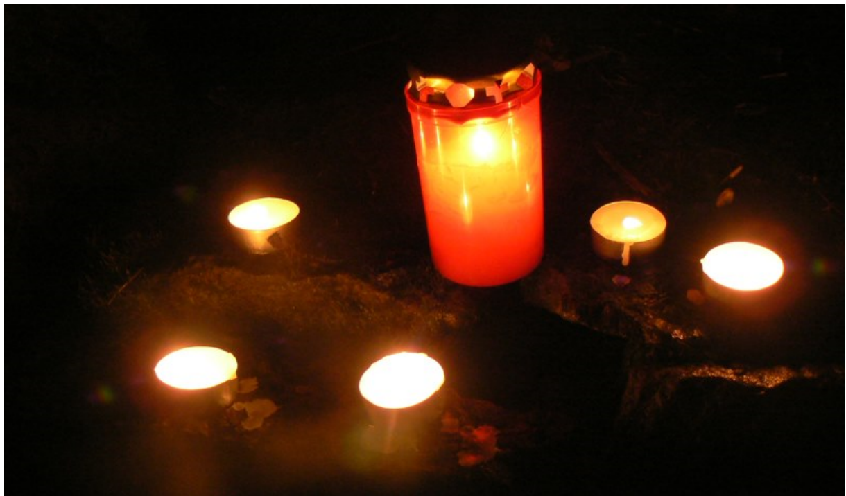
Trauer um die Opfer/ grief at the victims

Seit dem Zweiten Weltkrieg sind in Baden-Württemberg nicht mehr so viele Menschen auf einmal durch Menschenhand ausgelöscht worden.